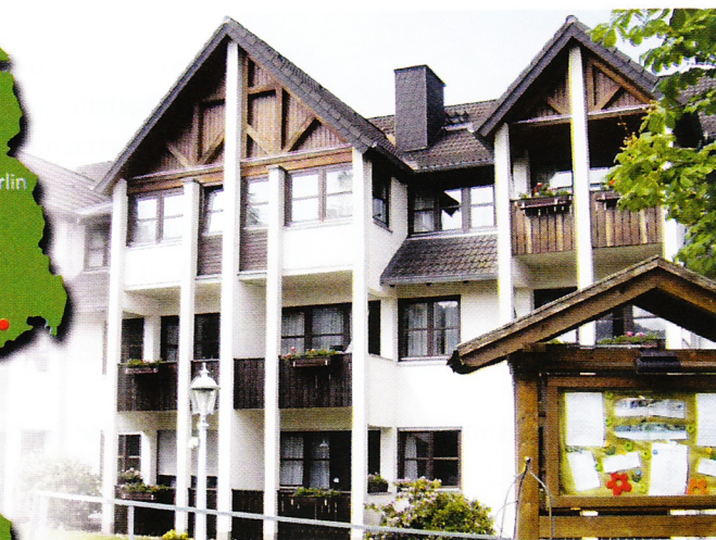
Die Seminare finden an 31 Schulungsorten statt, wie z. B. im Hotel Sonneck.

Die Firma verkehrsseminare marbs e. K. hat sich aus einem mittelständischen Taxiunternehmen in Nordhessen heraus entwickelt. Bereits seit 1998 bietet das Unternehmen nun schon Seminare für die IHK-Fachkundenprüfungen im Güterkraftverkehr und den Straßenpersonenverkehr an.